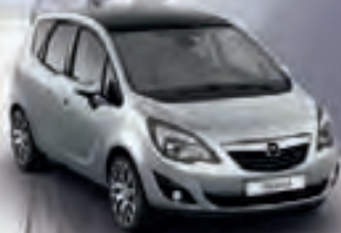
Sovereign Silver & Carbon Flash (Серебристый и Черный металлик)