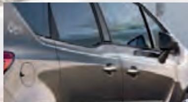
Цвет Silver Lake (Серебристый)

Набор элементов декора. Этот набор доступен в трех расцветках и выделит Ваш Opel Meriva из потока автомобилей.