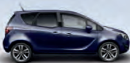
Royal Blue (Темно-синий)