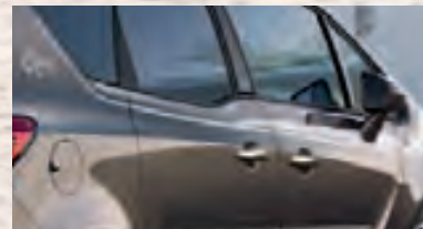
Цвет Star Silver (Серебряный)