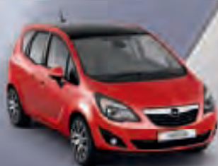
Magma Red & Carbon Flash (Красный и Черный металлик)