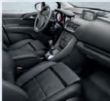
Кожа Mondial 1 , цвет-черный.