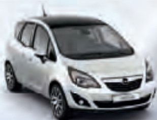
Casablanca White & Carbon Flash (Белый и Черный металлик)

Opel Meriva Design Edition. Шесть впечатляющих цветов окраски кузова с элегантной черной крышей. Это практичный семейный автомобиль с уникальным динамичным и стильным дизайном.