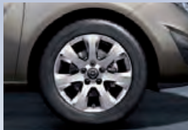
3 Легкосплавные колесные диски, 6.5 J x 16, 7-спиц, шины 205/55 R 16.