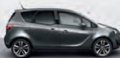
Asteroid Grey (Серый)