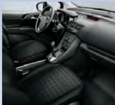
Отделка Salta, Jet Black/Atlantis, цвет – темно-серый.