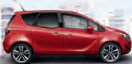
Magma Red (Красный)