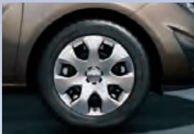
1 Стальные колесные диски с колпаками, 6.5 J x 15, 7-спиц, шины 195/65 R 15.