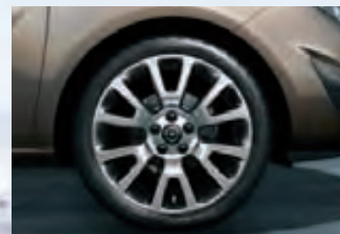
9 Легкосплавные колесные диски OPC Line, 7.5 J x 18, 5-двухцветных спиц, шины 225/40 R 18.