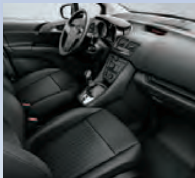
Отделка Рере/Atlantis, цвет-черный.