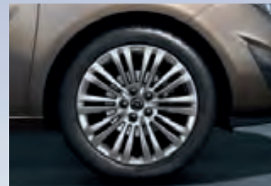
4 Легкосплавные колесные диски, 6.5 J x 16 или 7 J x 17, 10-двойных спиц, серебристые, шины 205/55 R 16 или 225/45 R 17