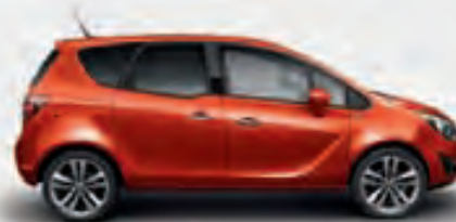
Henna (Оранжевый металлик)