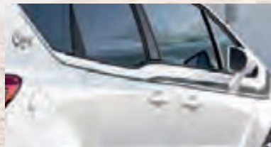
Цвет Asteroid Grey (Серый)