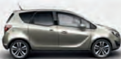
Pepper Dust (Серо-зеленый)