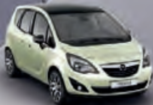
Guacamole & Carbon Flash (Белый и Черный металлик)