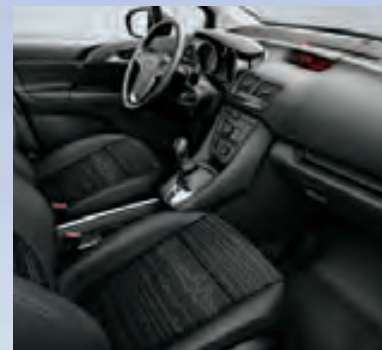
Отделка Skyline/Atlantis, цвет-черный.