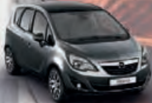
Asteroid Grey & Carbon Flash (Серый и Черный металлик)