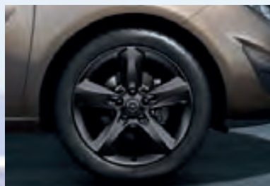
7 Легкосплавные колесные диски черного цвета, 7 J x 17, 5-спиц, шины 225/45 R 17.