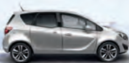
Sovereign Silver (Серебряный металлик)