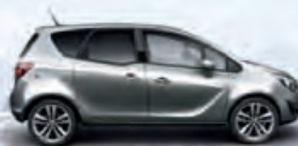
Silver Lake (Серебристый)