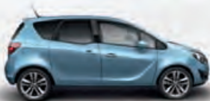
Crinan Blue (Голубой)