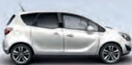
Casablanca White (Белый)