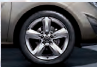
6 Легкосплавные колесные диски, 7 J x 17, 5-спиц, шины 225/45 R 17.