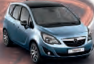
Crinan Blue & Carbon Flash (Голубой и Черный металлик)