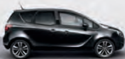
Carbon Flash (Черный металлик)