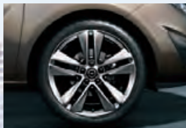
8 Легкосплавные колесные диски, 7.5 J x 18, 5-двойных спиц, шины 225/40 R 18. Металл с высококачественным многослойным покрытием.