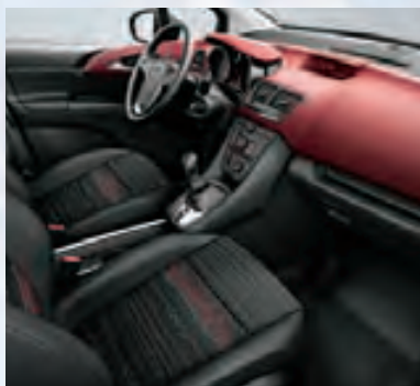
Отделка Skyline/Atlantis, цвет-красный/черный.