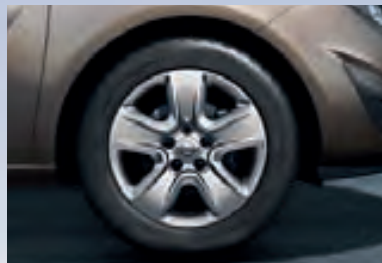
2 Структурные колесные диски, 6.5 J x 16, 5-спиц, шины 205/55 R 16.