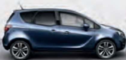
Waterworld (Синий металлик)